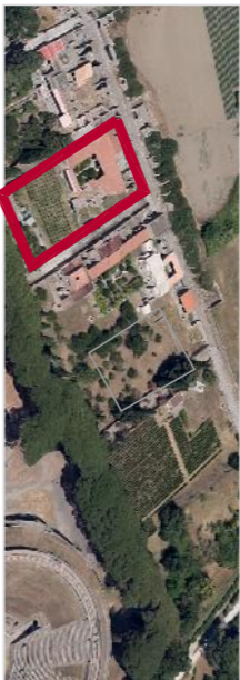
Foto aerea con individuazione Prædia Giulia Falce (Rigolo II, Insula 4, cx. 1)