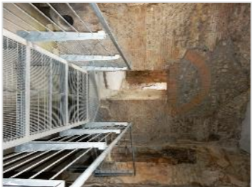
Foto 8 Tepidarium ambiente n. 41