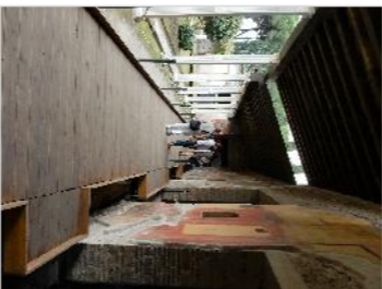
Foto 3 Porticato ambiente n.8