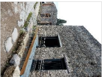
Foto 1 Ingresso da via dell'Abbondanza