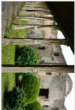
Fruizione Prædia Giulia Falce (Rigolo II, Insula IV, cx. 1) Opere di ampliamento percorso - Le Terme

MINISTERO DEI BENI E DELLE ATTIVITÀ CULTURALI E DEL TURISMO Soprintendenza Speciale Beni Archeologici