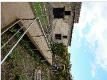
Foto 4 Rampa dall'hortus al viridarium