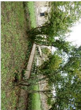
Foto 5 Inserimento della rampa nell'hortus