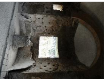
Foto 2 Calidarium ambiente n. 42