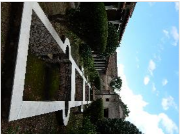
Foto 7 Vista del viridarium