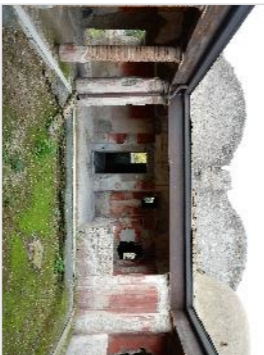
Foto 6 Altro delle Terme ambiente n. 104