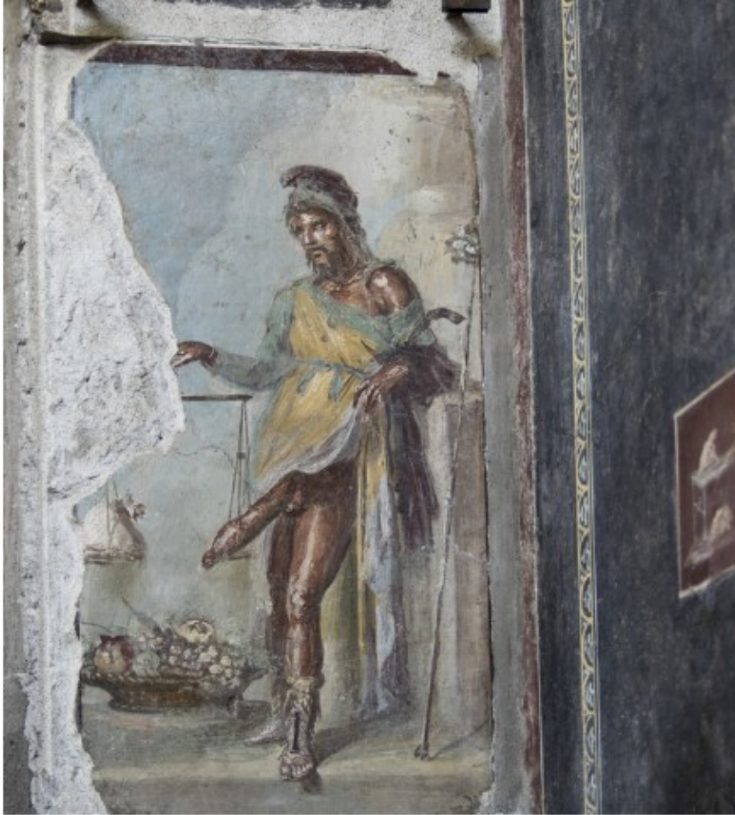
Priapus toont met brede grijns zijn indrukwekkende fallus. Silvia Vacca

zijn ogen niet. 'De oude muren begaven het en de helft van de antieke stad – met daarin de mooiste huizen – was wegens instortingsgevaar gesloten voor publiek.' Een plan van aanpak ontbrak en ieder overzicht was zoek: 'Eén deel van de site was nog niet gerenoveerd of een nieuw stuk was alweer ingestort.'