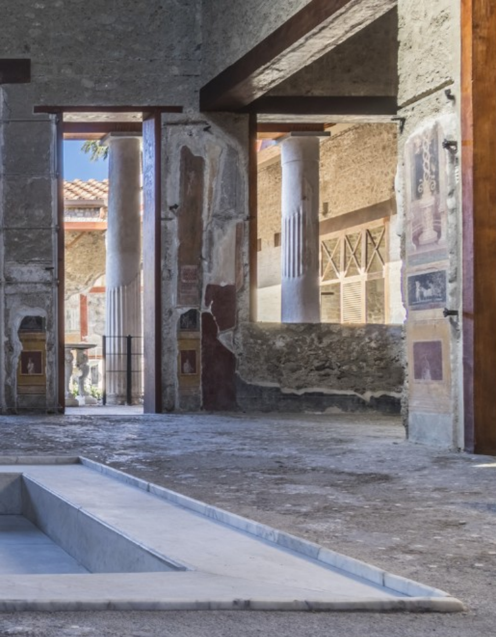
Het atrium of de binnenkoer van het huis van de Vettii. Silvia Vacca

Zelfs zonder al te veel verbeelding voelt een bezoek aan Pompeï als een tijdreis naar het jaar 79, toen het Romeinse provinciestadje aan de Zuid-Italiaanse kust bedolven raakte onder een metersdikke laag puin. Dat de met wijnranken begroeide berg in feite een actieve vulkaan was, wisten de Pompejanen niet. De jonge schrijver Plinius de Jongere zag het drama gebeuren en deelde jaren later zijn ervaringen per brief met de historicus Tacitus. Een vroeg voorbeeld van een journalistiek verslag.