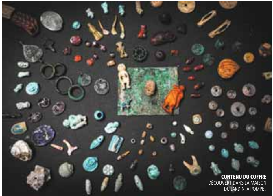
CONTENU DU COFFRE DÉCOUVERT DANS LA MAISON DU JARDIN, À POMPÉI.

Un trésor de sorcier ! Avec cette découverte originale, le site de Pompéi continue à livrer de nouvelles informations sur la vie des Romains au 1 er siècle apr. J.-C. Dans le nord de la ville, les archéologues qui fouillent depuis 2018 la « Regio V », un quartier resté enseveli et jamais exploré jusqu'à maintenant, ont découvert dans la maison du Jardin, l'une des domus récemment dégagées, une boîte contenant de nombreux objets qui étaient utilisés selon eux pour des rituels magiques : des porte-bonheur, des amulettes, des statues en os et en bronze, des scarabées en faïence bleue, ou encore des figurines représentant Dionysos, le dieu du Vin et de la Fertilité. Avec des perles de verres, des améthystes, des ambres, des cornalines, ces objets reposaient dans un