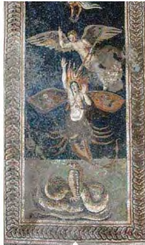
Cette mosaïque représentant le mythe d'Orion tué par le scorpion proviendrait de la Méditerranée orientale.

Une quinzaine de squelettes ont également été exhumés lors de ces nouvelles fouilles. Ainsi celui d'un homme boîteux qui reposait, sans tête. Les archéologues ont d'abord cru qu'il avait été décapité par un bloc de granit alors qu'il tentait de fuir. Avant de retrouver son crâne intact, séparé du corps par un effondrement de terrain postérieur à la catastrophe. « Les analyses montrent qu'il était âgé d'une quarantaine d'années, avait des dents en parfait état, et était en bonne santé